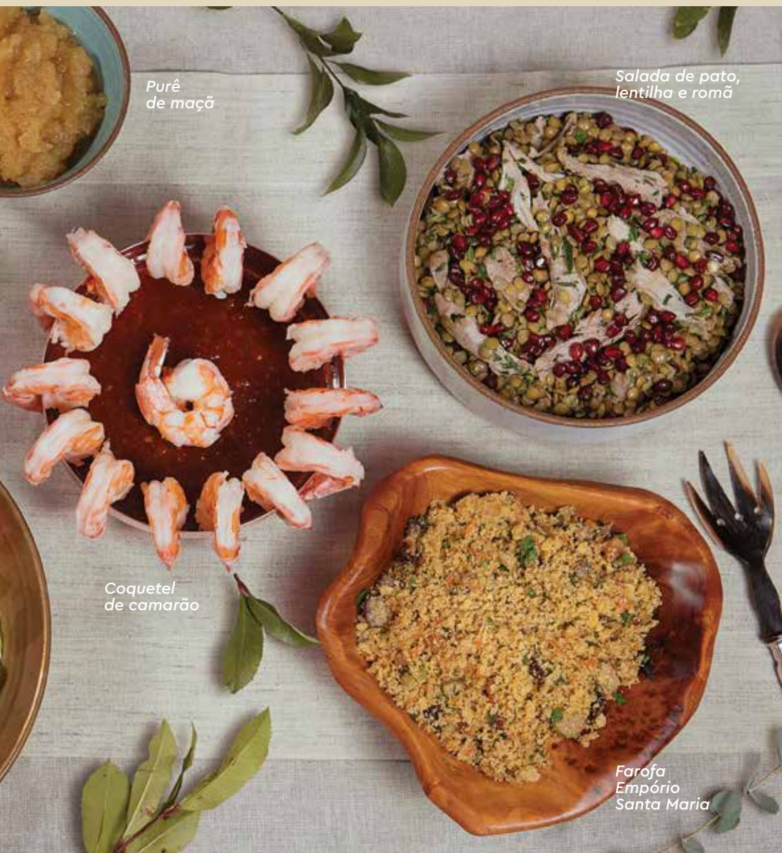
Purê de maçã